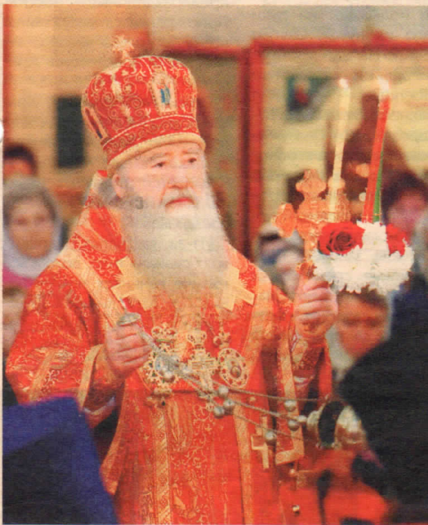
Возлюбленные служители Алтаря Господня, всечестные иноки и инокини, дорогие братья и сестры! ХРИСТОС ВОСКРЕСЕ!

Этими радостными и жизнеутверждающими словами сердечно поздравляю Вас с великим праздником Святой Пасхи. "Вчера спогребохся Тебе, Христе..." — воспевает мы в церковном песнопении, а сегодня вместе с женами-мироносицами, пришедшими на рассвете воскресного дня ко гробу Спасителя, трепетно внимаем словам Ангела: "знаю, что вы ищите Иисуса распятого; Его нет здесь — Он воскрес" (Мф. 28: 5, 6).