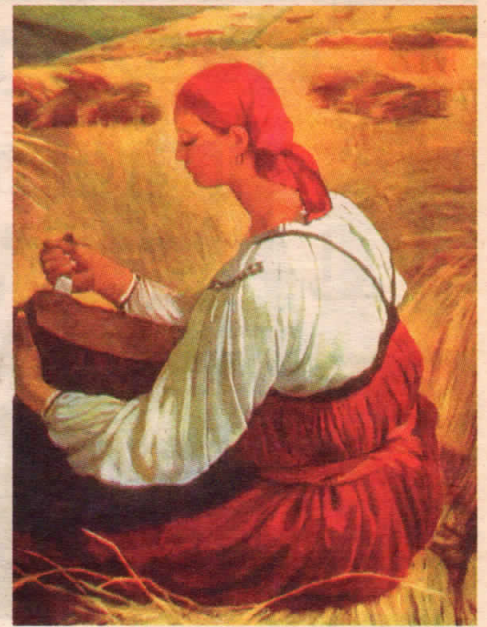
Серебрякова З. Е. Жатва. 1915. Одесский художественный музей.

Хлеб — это пища, благословленная Богом, и поэтому христиане никогда не отказывают дать кусок хлеба бедняку, который просит его Христа ради. Поэтому хлеб никогда не бросают и, если нечаянно роняют на пол, то целуют и просят у него прощения. Хлеб почитают во всем мире; питаюсь лишь им, человек будет жив и будет здоров. Его любят все. Это лучшее из всего, что рождает земля,