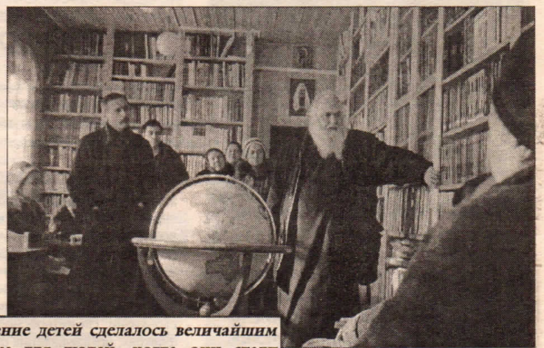
«Рождение детей сделалось величайшим утешением для людей, когда они стали смертными. Поэтому-то и человеколюбивый Бог, чтобы сразу смягчить наказание прародителей и ослабить страх смерти, даровал рождение детей, являя в нем образ Воскресения».

В музее изящных искусств нас окружили пейзажи и полотна Шишкина, Сурикова, Петрова-Водкина, Малявина... Поваяло атмосферой старины,