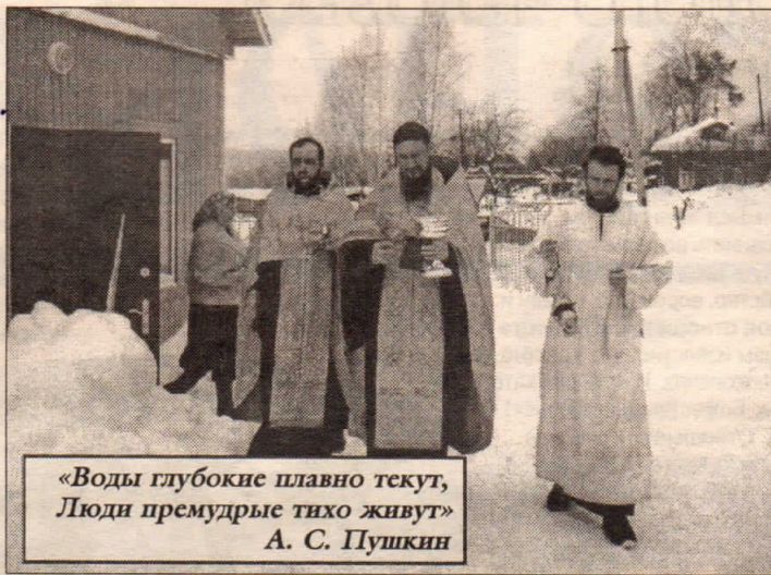
«Воды глубокие плавно текут, Люди премудрые тихо живут» А. С. Пушкин

Этот замечательного вида храм знают те, кто более или менее регулярно ездят из Сергиева Посада в Марьино, Дмитров, Талдом или вообще по третьему областному кольцу, весьма живописному. Расположенный прямо у дороги, среди старинного кладбища, он настолько открыт каждому встречному, что в сезон наружных восстановительных работ пассажиры рейсовых автобусов, дружно вращая головами, успевают на ходу разглядеть и то, с кем на дворе общается батюшка, и то, как, закрепившись на тропе, красит купол его помощник.