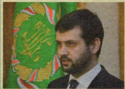
Председатель Синодального информационного отдела РПЦ В. Р. Легойда

В Русской Православной Церкви выражают удовлетворение конструктивным развитием диалога с Министерством здравоохранения и социального развития, в частности, вокруг законопроекта "Об основах охраны здоровья граждан РФ", на днях представленного президенту России.