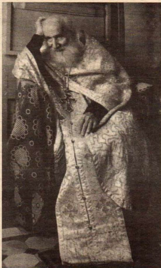
В главном алтаре Покровского храма села Акулово, 1980 г.