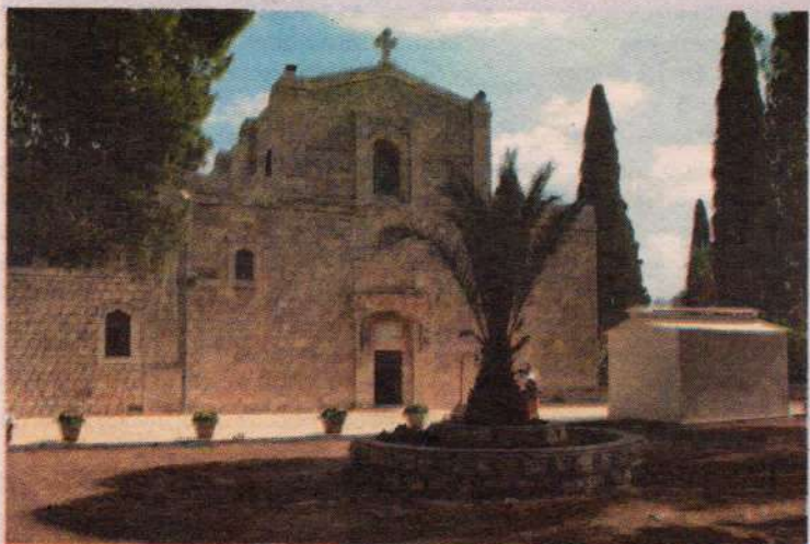
Святая Земля. Православный греческий женский монастырь Преображения Господня, расположенный в северо-восточной части вершины горы Фавор

Вдруг возникает всеобщее волнение: люди машут руками. Нас окутывает невесть откуда взявшийся туман! Все вокруг осеняют себя крестом, я тоже не отстаю и направляю в гущу событий объектив телекамеры.