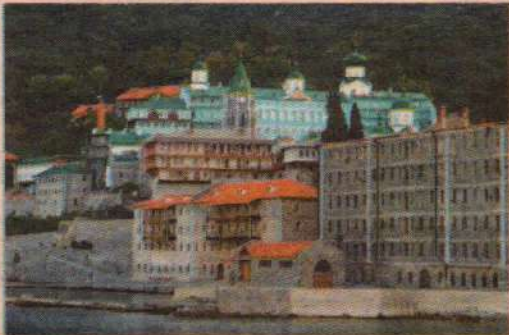
Свято-Пантелеимонов монастырь на Афоне, где хранится честная глава великомученика Пантелеимона

чежец. Мощи целителя Пантелеимона... Божий угодник явился сам, к нам, чьим немощам несть числа, ко мне, сидящей в тенёчке под синим зонтиком, так уставшей от саднящей на лбу раны. Вот уж поистине скорая помощь! Не дерзну даже приблизить мысль, что были услы-