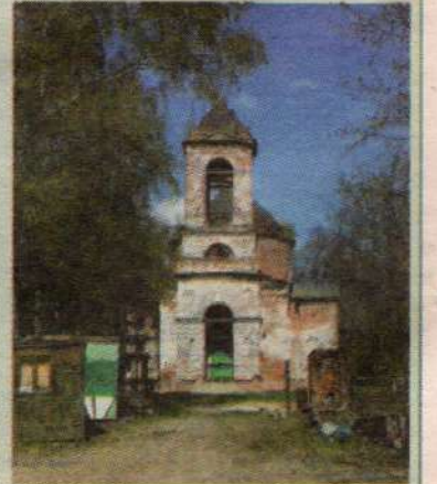
Троицкий храм деревни Новая Шурма

Престольный праздник Троицкого храма села Новая Шурма.