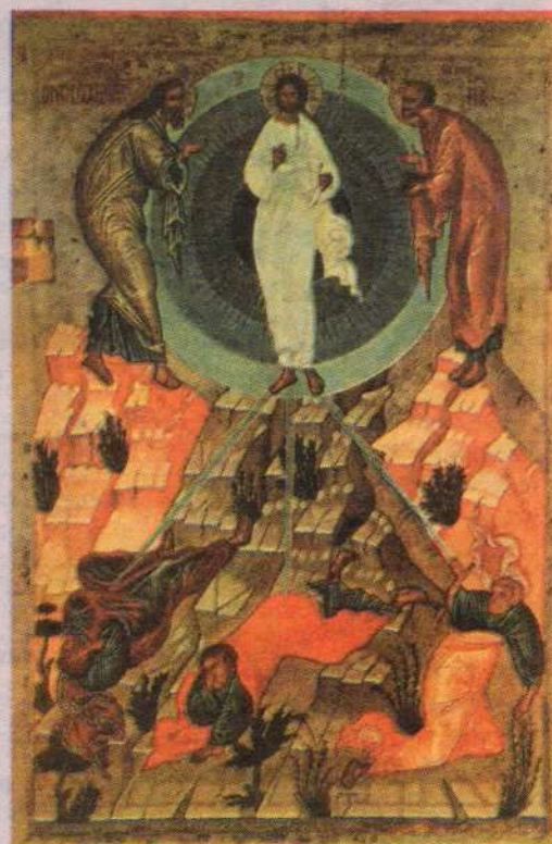
Преображение Господне. Икона, Новгород, XV век

После освящения храма священники стали замечать, что каждый год на праздник Преображения неизменно появлялось облако. Иногда облаков бывало много. Даже и в безветренную погоду они прилетали к храму и покрывали собой Фаворскую гору. Август в этой местности — самый засушливый месяц, на небе ни облачка. А тут такое чудо.