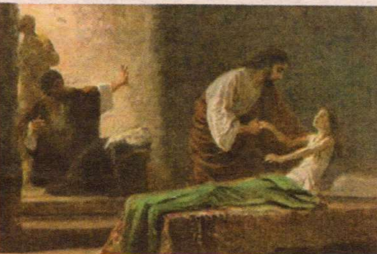
Роберт Ляйнвебер. Воскрешение дочери Иаира

от грехопадения, от того, сего. Как всякое зло она бессмысленна. Смысл имеет только то, что Господь сотворил. А зло, болезнь, грех не имеют смысла. Что такое грех? Взяли хорошую вещь, испортили. Ведь под