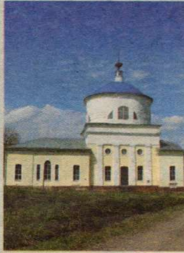
Успенский храм села Закубежье

14, четверг. Происхождение (изнесение) Честных Древ Животворящего Креста Господня. Начало Успенского поста.