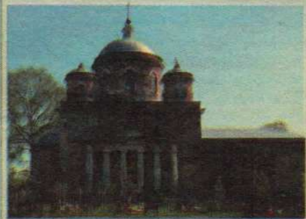
Успенский храм села Подсоино

28, вторник. Седмица 13-я по Пятидесятнице. Успение Пресвятой Владычицы нашей Богородицы и Приснодевы Марии.