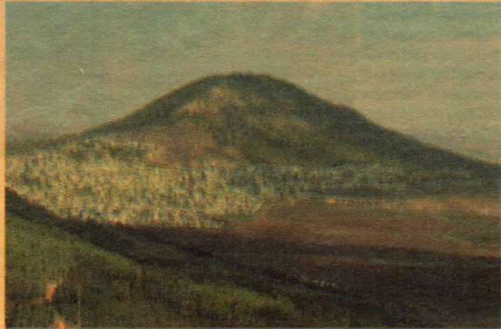
Святая гора Фавор

"Когда же он говорил это, явилось облако и осенило их; и устрашились, когда вошли в облако. И был из облака глас, глаголющий: Сей есть Сын Мой Возлюбленный, Его слушайте."