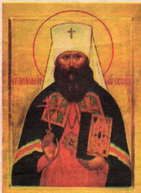
Священномученик Вениамин Петроградский

Родившийся в семье сельского священника Андреевской волости Каргопольского уезда, Василий Казанский — таково было мирское имя Владыки Вениамина — с детских лет не понаслышке знал о том, что такое нужда и бедность. Спустя годы, будучи уже студентом Санкт-Петербургской Духовной Академии, он стремился к «отверженным», участвуя в делах благотворительности и в деятельности «Общества распространения религиозно-нравственного просвещения в духе Православной Церкви», направленной, в основном, на помощь рабочим и беднякам.