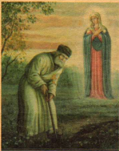
Явление Пресвятой Богородицы преподобному Серафиму Саровскому