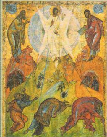
Преображение Господне. Икона. Феофан Грек, н. XV в.

Престольный праздник Успенской церкви села Закубежья.