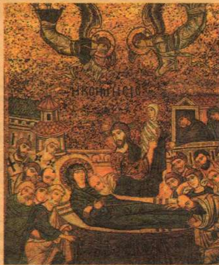
Успение Богородицы. Мозаика, XII в., церковь Санта Мария дель'Аммиральо ("Ла Марторана") в Палермо.

ют Ее в путь всей землей, и тут же, на этой иконе, образ Христа-Спасителя, который держит маленького человека, держит душу Богородицы. Так что в одной иконе два события — и смерть, и воскресение, — чтобы мы не забывали что и внутри нас сокрыты и жизнь, и смерть.