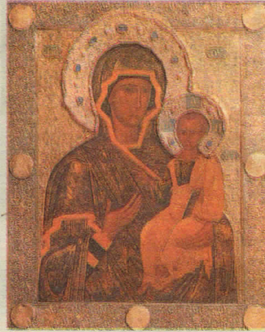
Богородица Одигитрия Смоленская. Первая четверть XVI в. Новодевичий монастырь.

Э ту икону привезла на Русь в 1046 году византийская принцесса Анна, дочь императора Константина Мономаха, вышедшая замуж за черниговского князя Всеволода Ярославича. После его смерти княгиня Анна благословила его сына Владимира Всеволодовича Мономаха, ставшего Смоленским князем в 1097 году. Он и перенес икону в Смоленск. Одно из первых известных чудес от иконы – спасение города во время нашествия хана Батые в 1237 году. В XV веке икону перенесли в Москву, но по настойчивым просьбам горожан вернули в Смоленск, а для Москвы написали точную копию. В 1524 году был основан Новодевичий монастырь, а годом позже для него сделали список с чудотворной иконы. В XVII веке к иконе была сделана новая рама с изображением праздников в клеймах.