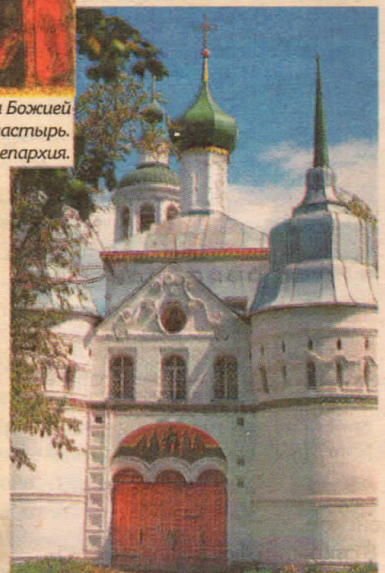
Святые ворота Толгского монастыря. Вид со стороны Волги.

Хотьковского монастыря хранилась чтимая Толгская икона, принадлежавшая некогда царице Прасковье Федоровне. Чтимая икона Богородицы была в Толгской церкви Высоко-Петровского монастыря в Москве, построенной в честь чудесного спасения царя Петра I в Троице-Сергиевой лавре во время стрелецкого бунта.