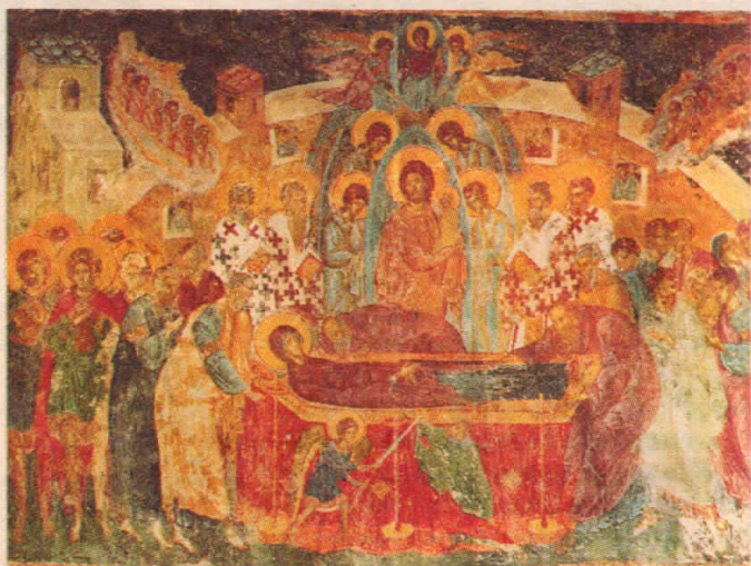
Успение Богородицы. Монастырь Перивлепты. Мистра, Греция

Как человек пришел бы к Богу, если бы Бог не пришел к человеку? Именно эта тайна Церкви находит в празднике Успения свое завершение. Как Бог пришел к нам через Приснодеву Марию, так и мы, каждый человек может прийти к Богу только через Нее. Ныне история человечества продолжается, устремляясь ко второму Пришествию Христову. И если смысл истории, как радостно утверждает наш праздник, – соединение Бога с человеком, мы не можем не видеть, что сегодня человек в титанических усилиях хотел бы достигнуть, как говорит святой Ириной Лионский, чтобы исчезла всякая разница между Богом и