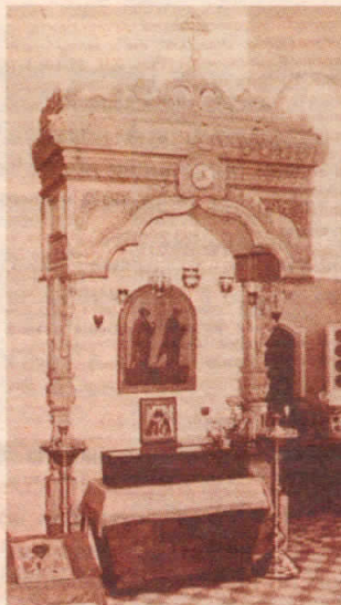
Рака свт. Василия Кинешемского. Свято-Введенский монастырь, г. Иваново.