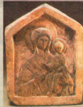
Богородица Одигитрия Смоленская. XV в. Василий Ермолин (?). СПГХМЗ.

Э ту икону привезла на Русь в 1046 году византийская принцесса Анна, дочь императора Константина Мономаха, вышедшая замуж за черниговского князя Всеволода Ярославича. После его смерти княгиня Анна благословила его сына Владимира Всеволодовича Мономаха, ставшего Смоленским князем в 1097 году. Он и перенес икону в Смоленск. Одно из первых известных чудес от иконы – спасение города во время нашествия хана Батые в 1237 году. В XV веке икону перенесли в Москву, но по настойчивым просьбам горожан вернули в Смоленск, а для Москвы написали точную копию. В 1524 году был основан Новодевичий монастырь, а годом позже для него сделали список с чудотворной иконы. В XVII веке к иконе была сделана новая рама с изображением праздников в клеймах.