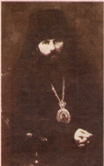
Епископ Кинешемский Василий. 1921 г.

Но не меньшее внимание уделяли родители и тому, какое образование получит их сын. По окончании гимназии Вениамин поступил в Киевскую Духовную Академию, которую окончил в 1901 г. со степенью кандидата богословия. По