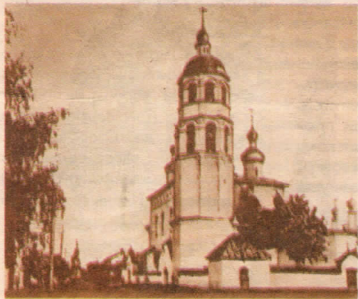
Город Кинешма. Вознесенская церковь.