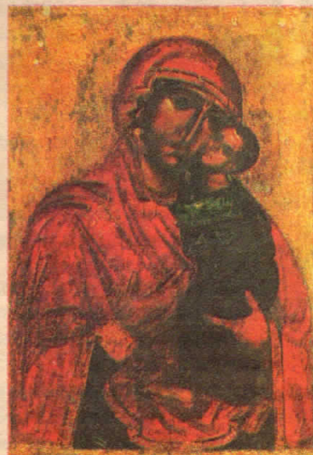
Чудотворная Толгская икона Божией Матери. XIV в. Толгский монастырь. Ярославская епархия.

На другой день слуги епископа, посланные на другой берег реки за жезлом, в лесу на дереве нашли икону Богородицы. Епископ Трифон поставил на месте явления иконы церковь, а позднее здесь был основан монастырь. До XVII века икона была местночтимой святыней, а с середины XVII столетия приобрела общерусское почитание. Служба в честь явления иконы была со-