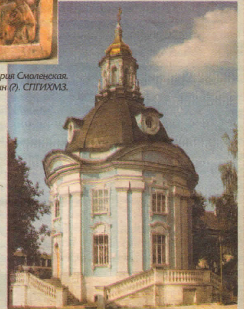
Церковь Смоленской иконы Богородицы. 1745-1748 гг. Троице-Сергиева лавра.

В Смоленске хранился чтимый список с чудотворной иконы, написанный в 1602 году. Эта икона в 1812 году была унесена из Смоленска русскими войсками при отступлении и постоянно находилась с ними. Накануне Бородинской битвы ее носили по лагерю для воодушевления воинов. После каждой победы перед ней служили молебны. После освобождения Смоленска от французов ее вернули на прежнее место.