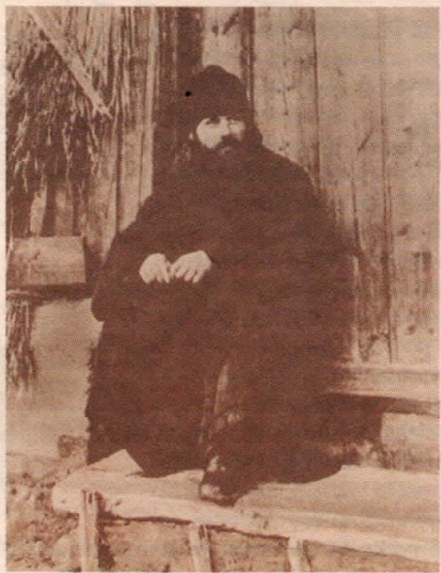
Епископ Василий на пороге бани. 1922 г.

— Вскоре наступят праздничные дни пасхального торжества. Когда вы придете от