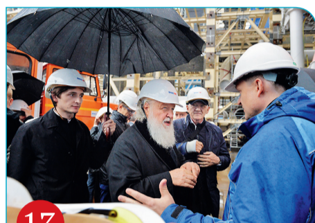
13 Сабетта. Посещение завода «Ямал СПГ» и освящение храма