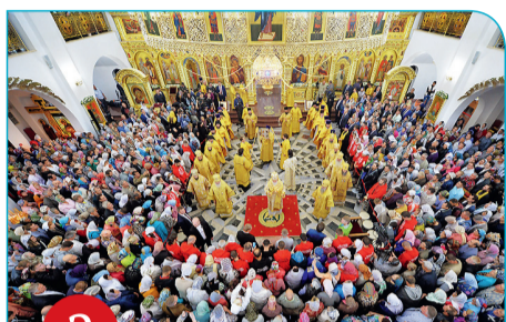
2 Южно-Сахалинск. Освящение кафедрального собора