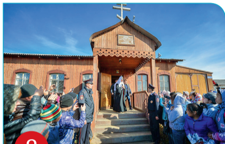
8 Лаврентия. Молебен в храме