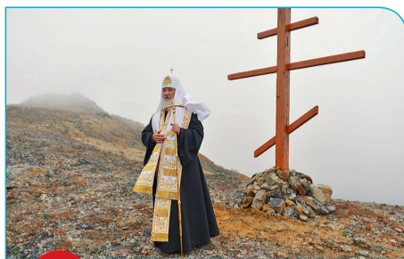
9 Остров Ратманова. Молебен о мире