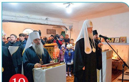
10 Бухта Провидения. Молебен в храме