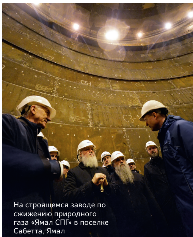
На строящемся заводе по сжижению природного газа «Ямал СПГ» в поселке Сабетта, Ямал