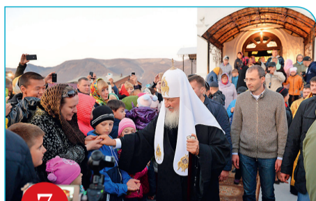
7 Эгвекиот. Освящение храма