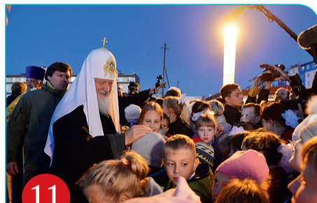
11 Угольные Копи. Закладка храма