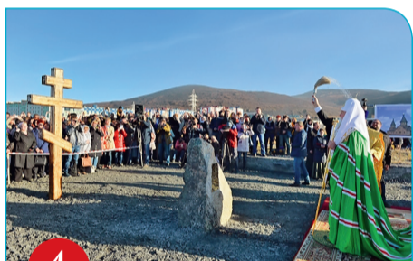
4 Певек. Закладка храма