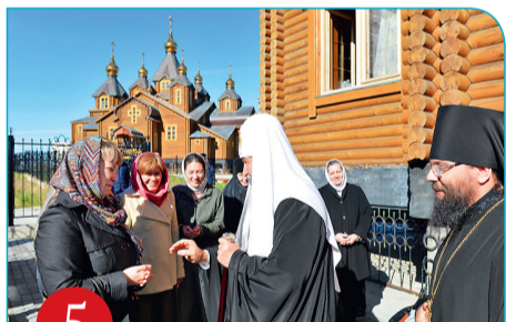
5 Анадырь. Литургия в соборе и закладка храма