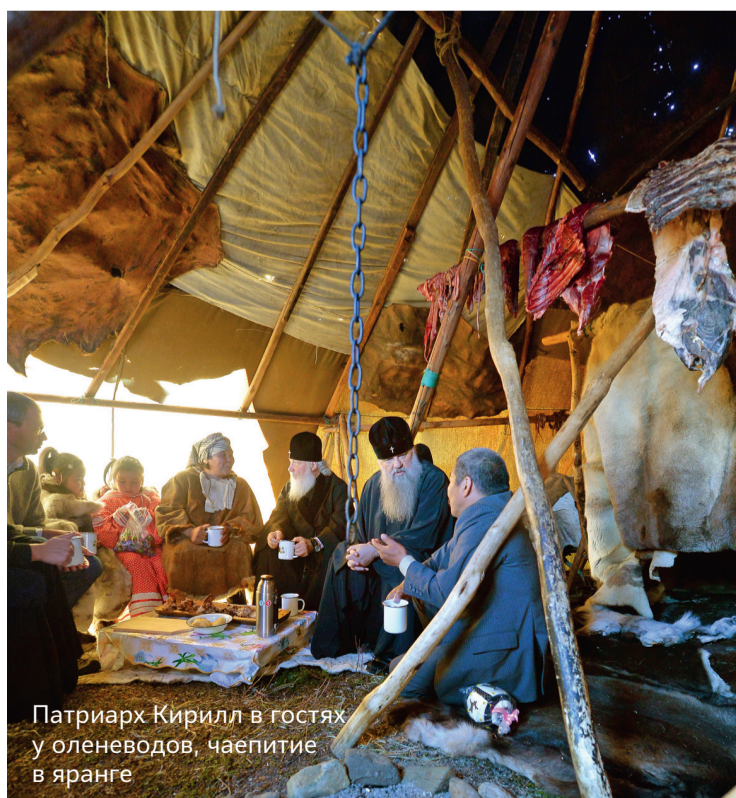
Патриарх Кирилл в гостях у оленеводов, чаепитие в яранге

«В моём сознании Чукотка никогда не была далёкой провинцией, и километры, которые отделяют её от Москвы, — тоже некоторая условность. О таких местах, как Чукотка, можно говорить, что с них начинается Родина — здесь восстаёт солнце, которое идёт затем над всеми необъятными просторами нашей страны и всего мира».