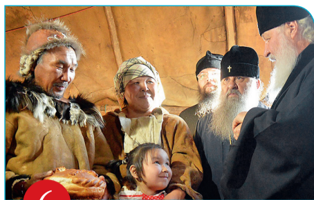
6 Канчалан. Посещение оленеводческого стана