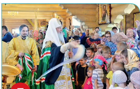
3 Невельск. Освящение храма