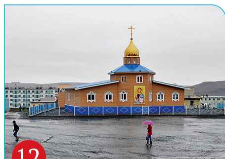
12 Тикси. Молебен в храме