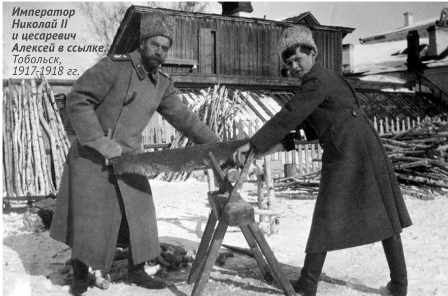
Император Николай II и цесаревич Алексей в ссылке. Тобольск, 1917-1918 гг.

Но даже под давлением заговорщиков император не решился пойти против закона и совести. Составленный им манифест явно не устроил посланников Государственной Думы. Тот документ, который в итоге был обнародован как текст отречения, у ряда историков вызывает сомнения. Оригинал его не сохранился, в Российском государственном архиве имеется лишь его