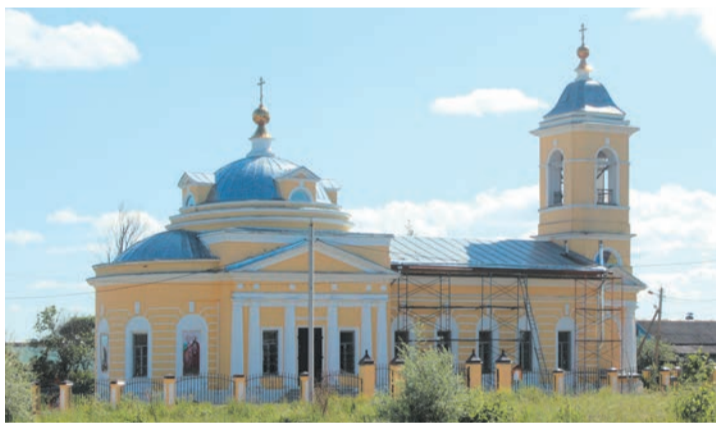
Никольский храм, современный вид

Духовенство и прихожане Сергиево-Посадского благочиния