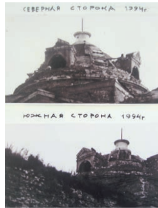
Руины Никольского храма, 1994 год